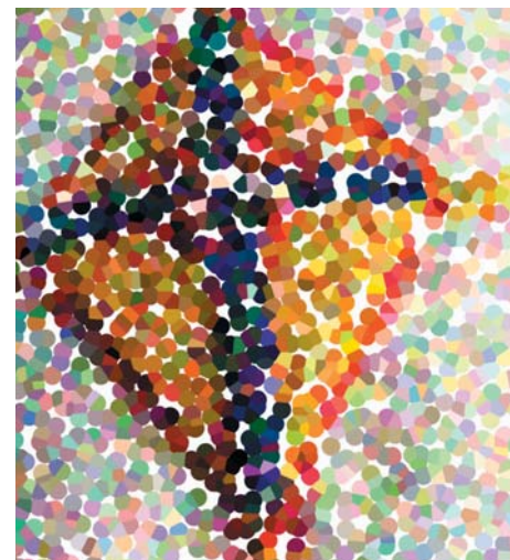
Illustration: del av stola Stockholms stift "samiska kretsen". Bearbetad bild. Britta Marakatt -Labba 2006